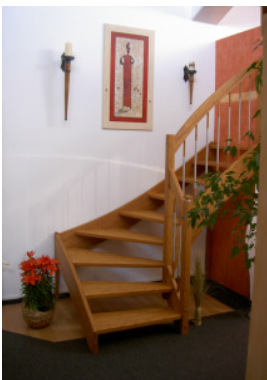
Bild HWT106 Holzwangentreppe BAVEG-HWT in Bambus massiv